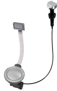
Automatischer Abfluss Space - PE 8407 109